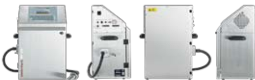
WP Serie Wire Processing

Inkjetdrucker für Farbstoff- und leucht pigmentierte Tinten