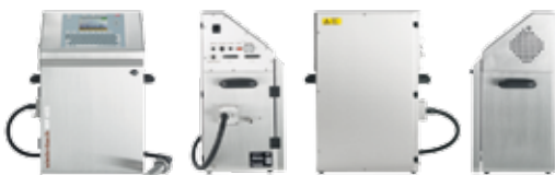
WP Serie Wire Processing

WIEDENBACH INDIVIDUAL INKJET MARKING SOLUTIONS