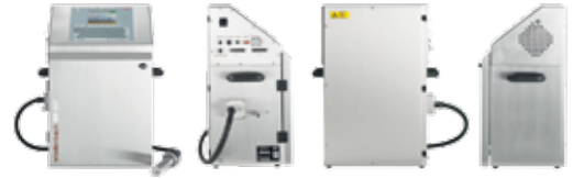
WP Serie Wire Processing